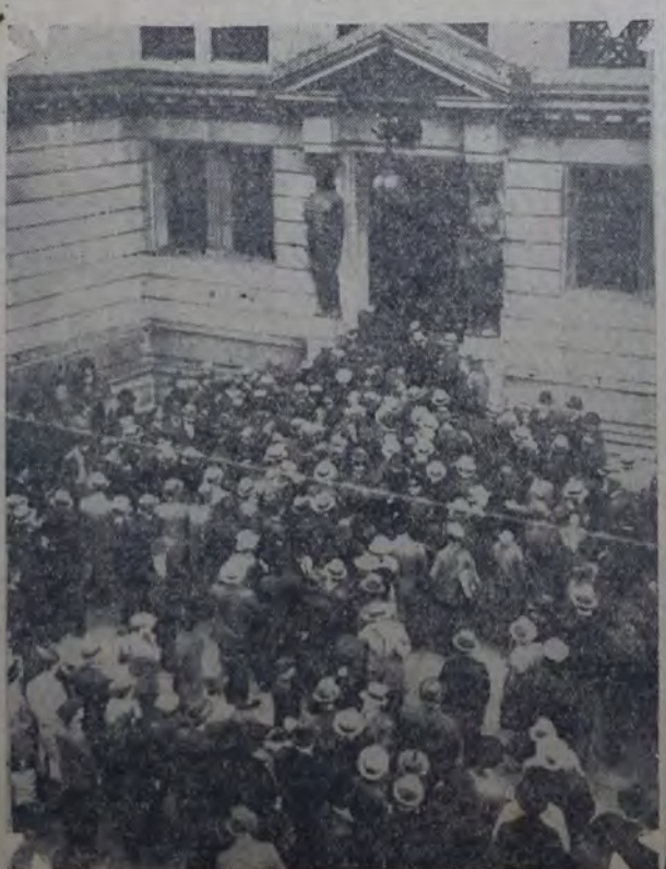
PUBLICO ENTRANDO AL SENADO EN LAS PRIMERAS HORAS DE la tarde de ayer. El aumento de concurrencia originó, poco más tarde, la clausura de las puertas de acceso.

había sido reclutada en los comités, y llevada hasta el congreso por varios caudillos personalistas. Cuando llegaba a la casa algunos de los senadores o diputados de esta filial, se veía rodeado de inmediato por numerosas personas que pugaban por entrar con ellos en el interior del palacio; algunos lo conseguían, pero la numerosa policía estacionada en ambas puertas, obligaba a los más a permanecer en la calle a la espera de una nueva oportunidad. Como la tentativa se repitiera varias veces y la concurrencia fuera en aumento, cerróse, por orden de la presidencia, la puerta que se encuentra próxima a la calle Posos, por donde entran ordinariamente los periodistas. (Continúa en la 2a. pág.)