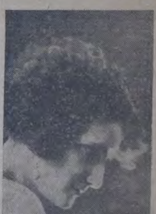
LA PRESTIGIOSA PRIMERA ACTRIZ ESPAÑOLA que esta noche celebrará su función de honor y beneficio en el teatro Maipo